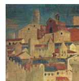
Persona e mercato

Mercoledì 30 aprile 2014, ore 10:30 Firenze, Istituto Italiano di Scienze Umane Palazzo Strozzi, Piazza degli Strozzi